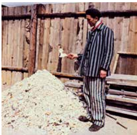
Befreiter Häftling vor einem Knochenhaufen im Innenhof des Krematoriums Buchenwald. Foto: Ardean R. Miller, U.S. Signal Corps, 18. April 1945. National Archives, Washington

Weitere Infos und Anmeldung: Jugendwerk der AWO Württemberg Tel.: 0711 94572910 www.jugendwerk24.de info@jugendwerk24.de