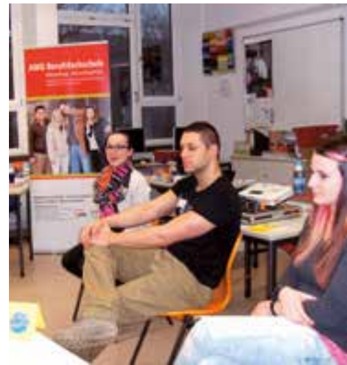
Die Werkrealschüler informieren sich über den Beruf des Altenpflegers