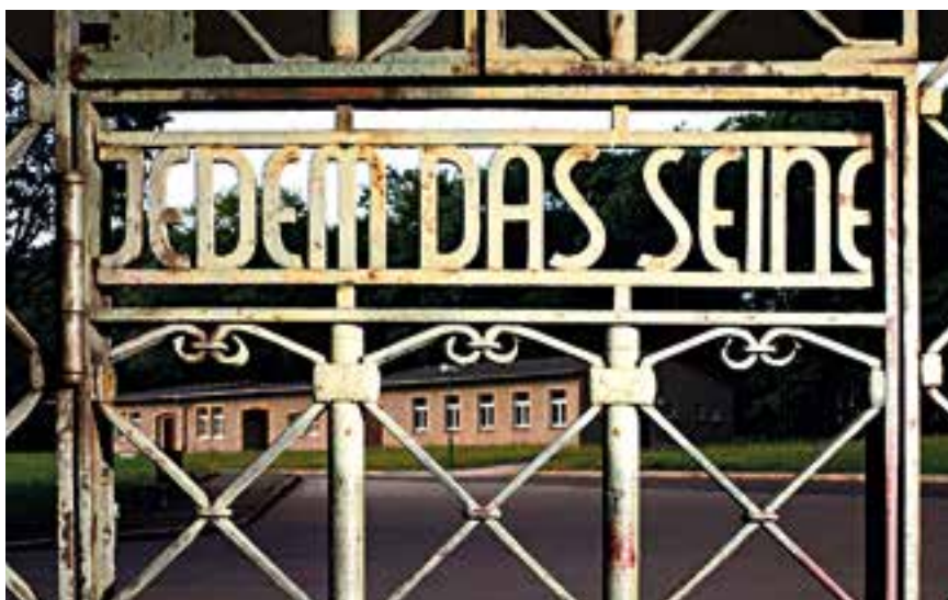
Die zynische Inschrift am Tor des KZ Buchenwald ist ein Sinnbild für die menschenverachtende Ideologie des Nationalsozialismus.