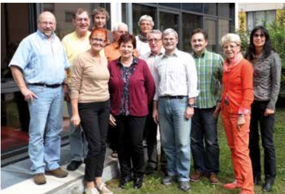
Gute Stimmung beim Seminar „AWO unterwegs“ der AWO-Akademie.

Bitte schon jetzt den 10. Mai 2014 im Kalender vormerken! Wir freuen uns auf reges Interesse.