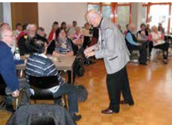
Zauberer Amadeus verblüffte die Gäste mit seinen Tricks.