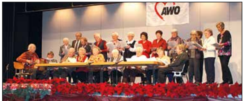
Die Singgruppe der AWO Langenau bei ihren ersten Auftritt.

Es gab freilich Gegenwind aus den alten Strukturen. Die Spreu musste vom Weizen getrennt werden. Aber nun sind wir auf einem guten Weg.