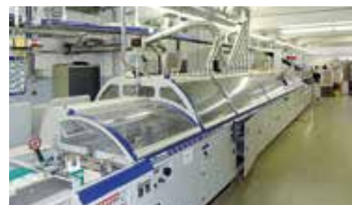
Für das AWO-Heft im Einsatz: ein moderner Sammelhefter.