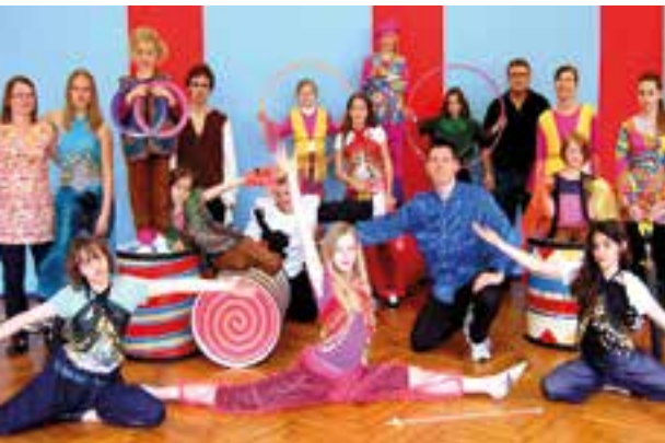
Die Zirkusgruppe Fitze Fatze der AWO Geislingen und das Jugendwerk organisieren im Sommer eine Zirkustournee durch AWO Waldheime.

Im Sommer 2014 werden gleich zwei Projekte mit verschiedenen Waldheimen durchgeführt. Vom 2. bis 13. August 2014 werden bei der InterCoolTour wieder mit Gästen aus Mexiko Waldheime besucht und ein Spiel- und Erlebnistag für Kinder angeboten. 10- bis 15-Jährige können vom 31. Juli bis 13.