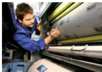
Korrektur auf der Druckplatte, unten ist der Gummizylinder zu erkennen