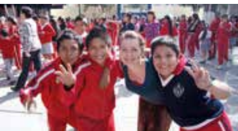
Die mexikanischen Schulkinder waren begeistert vom Besuch aus Deutschland.

Auch in Mexiko gab es eine gemeinsame Aufgabe: ein abwechslungsreiches Freizeitprogramm für Schulkinder, zuerst in einer Schule mit 300 Kinder in Guadalajara, zweitgrößte Stadt Mexikos. In der zweiten Woche besuchten die Gruppe eine kleinere Schule mit 40 Kindern im Dorf La Resolana. Nach Bewegungsspielen im Freien wurde gebastelt und gemeinsam typisch deutsches Essen gekocht. Neben dem offiziellen Programm unternahmen wir auch Ausflüge, um Land und Leute kennenzulernen.