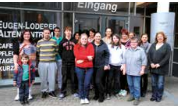
Die „Neuen“ erfahren, was die AWO ausmacht.

Zentrale Botschaft ist, dass sich neue Mitarbeiter und Mitarbeiterinnen wohl fühlen und wissen, mit wem sie es zu tun haben. Eine Frage- und Antwortrunde beendet den Nachmittag. Mittlerweile haben vier dieser Veranstaltungen stattgefunden. Vorstand und Geschäftsführung sind sich einig, dass dieses Angebot, das natürlich in der Arbeitszeit stattfindet, in den Jahresplan des Kreisverbands aufgenommen wird.